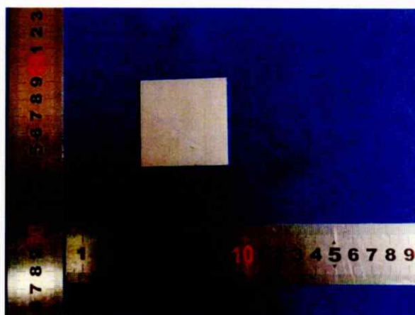
部件编号 1: 层架/台面