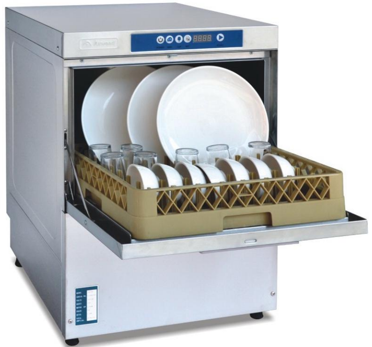
AXE-302D / AXE-301D